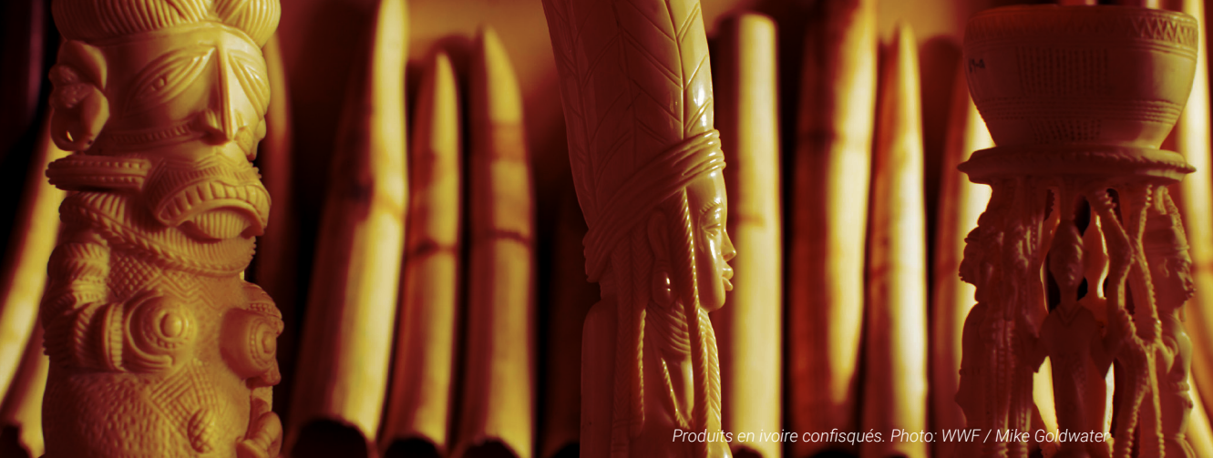
Produits en ivoire confisqués.